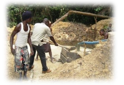
ダイヤモンド採掘作業を体験するDFPコーディネーター(写真中央)