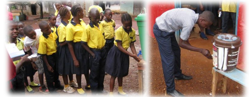
配布された石けんを手洗いをする生徒たち

リベリアでは、エボラウイルス病の流行のため閉鎖されていた学校が 2015 年 3 月に再開されました。DFP は貧困地域の子どもたちが通う学校へ衛生用品（体温計、手洗い用石けん）を配布し、手洗い方法の確認・モニタリングを行いました。