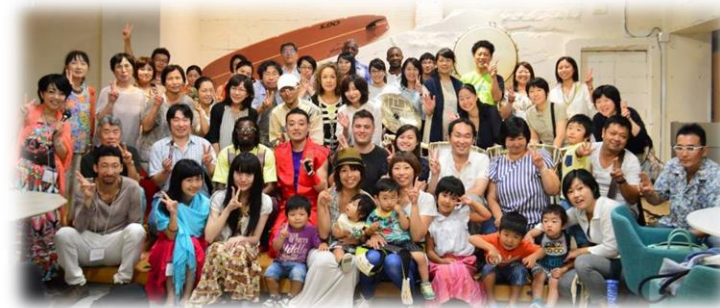
イベント「No Drum, No Life」参加者との集合写真

2015年8月22日、「No Drum, No Life」をテーマに、表参道にてイベントを開催、46名の皆さまにお集まりいただきました。その他、2015年度からアフリカで活躍するゲストスピーカーを招いての勉強会「世界とつながろう！DFP TALK」をスタートし、3回開催しました。